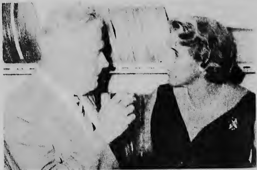
Un di e invitadonan na e apertura di Tele-Aruba dia-domingo anochi tabata ex-gobernador drs. A.B. Speekenbrink kende nos ta mira aki na robz den conversacion cu un di e otro presentenan, na e inauguracion.